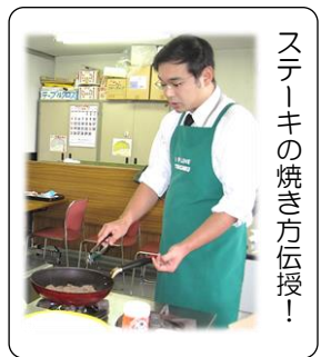
ステーキの焼き方伝授!