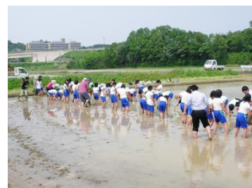
今年6月、田植えをしてくれた鳥取県の子供たち

ついたお餅は、12月3日（土）に京都生協と鳥取県畜産農協のボランティア総勢30名が宮城県南三陸町の被災者へお届けします。