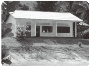
生協の支援で建設された「就学前教育施設」

ラオスは東南アジアの中でも最も貧しい国 のひとつです。5歳未満の子どもの死亡率も 高く、他のアジア諸国と比べ国際支援が届き にくい等の状況があります。京都生協は関西・ 中四国の17生協と協力して、乳幼児や女性を 支援する計画への募金を続けています。 (昨年度の募金金額は18生協で約1,748万円)