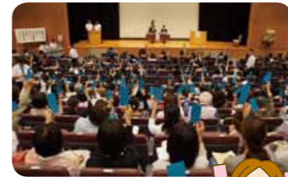
1年間の振り返りと、次の1年の方針を決めます