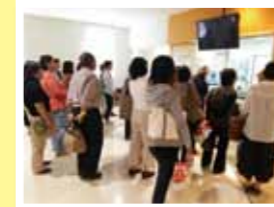
産地・工場など見学

生協のとりくみを知るために、いろんなところへ出向いたり、実際に商品試食やテストをして学習します(一例)