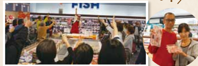
「かま」と「中落ち」の部分はじゃんけん見事「かま」を大会で争奪戦に。大いに盛り上がり葛っとなお2人