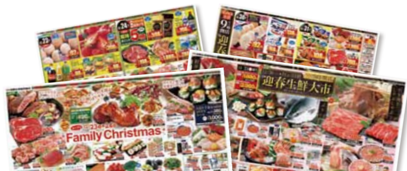
※チラシはイメージです

※年末のコープのお店は営業時間が変わります! それぞれのお店のチラシを欠かさずご覧ください。