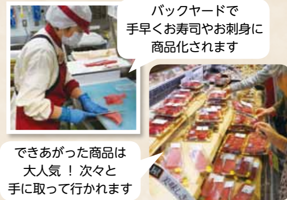
バックヤードで手早くお寿司やお刺身に商品化されます