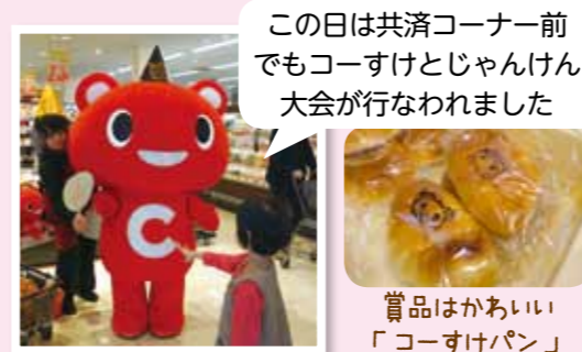
この日は共済コーナー前でもコーすけとじゃんけん大会が行なわれました