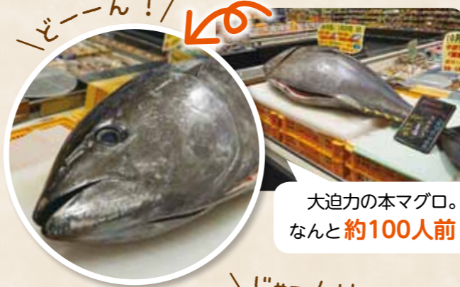
大迫力の本マグロ。なんと約100人前!

良く晴れた日曜日、本マグロの試食・販売イベントが行なわれました。大盛況の様子をお届けします。