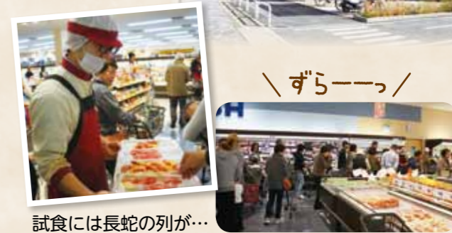
試食には長蛇の列が...