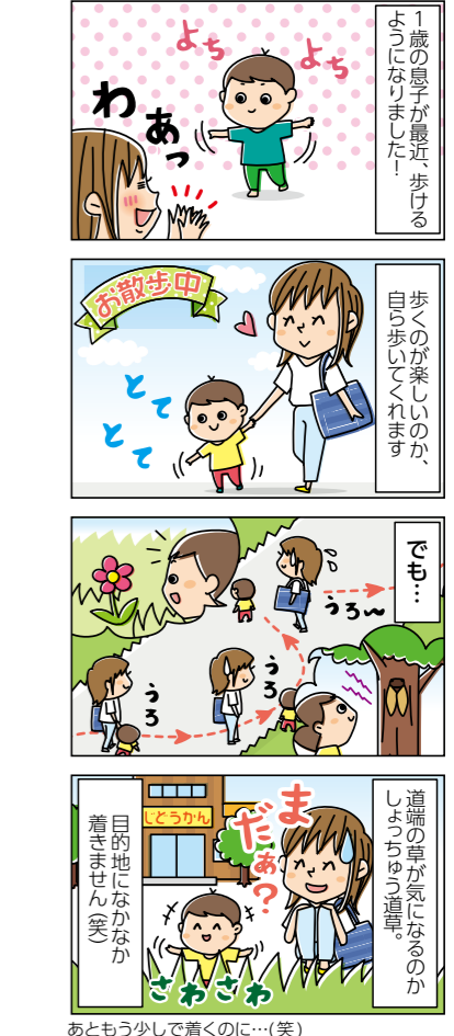
あともう少しで着くのにな…(笑)