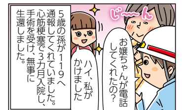
孫は命の恩人です！