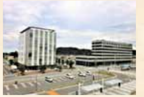
▲JR常磐線広野駅前には新しくオフィスビルやホテルが建ち、再開発が進みます。