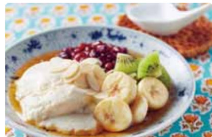
トウファ 豆花 烏龍シロップがけ