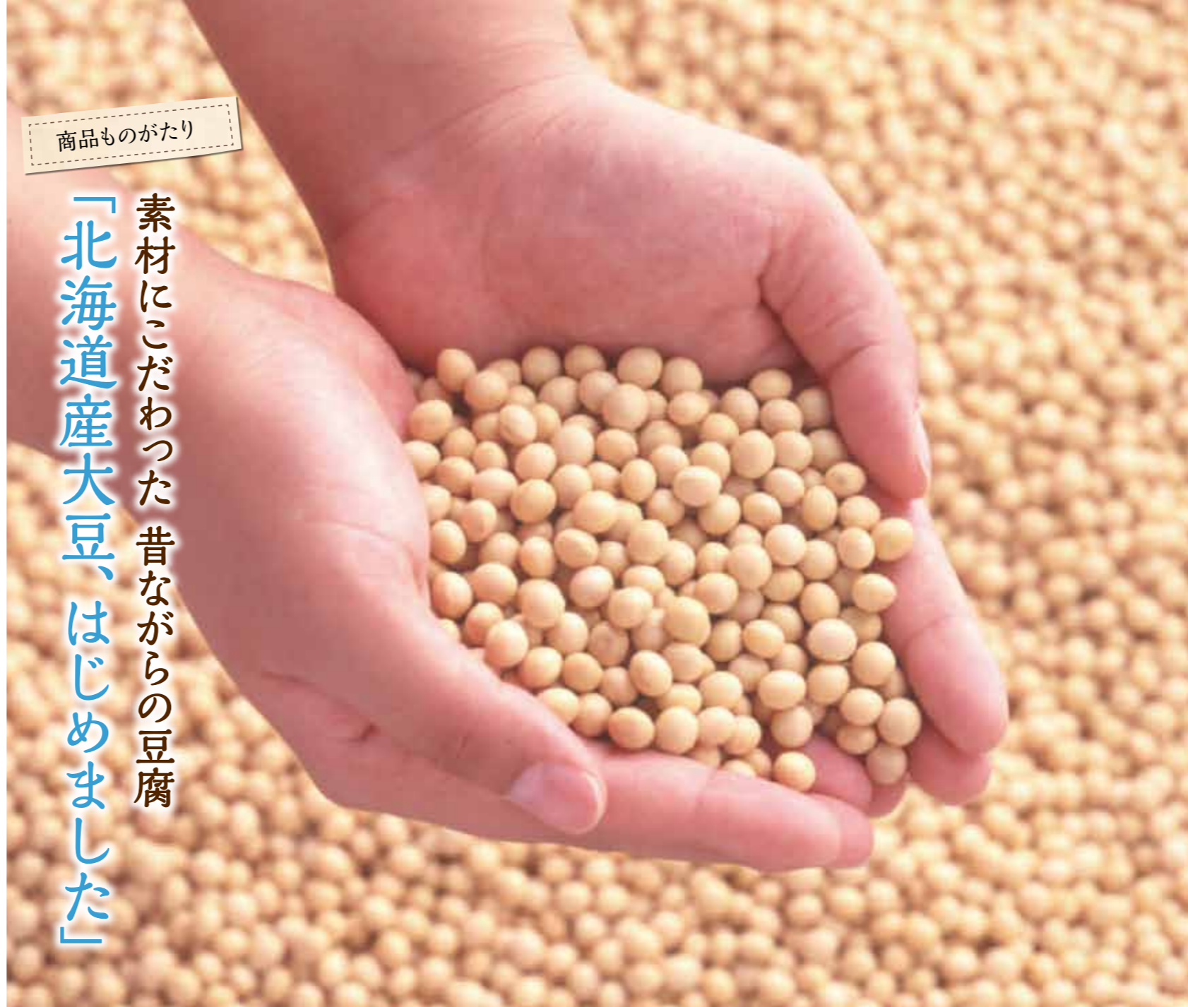
▲素材にこだわり、厳選された大豆。比較的大粒のものを選びすぐっています