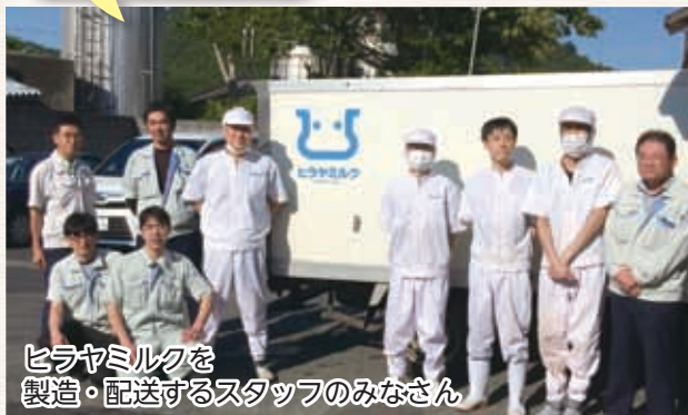
ヒラヤミルクを 製造・配送するスタッフのみなさん