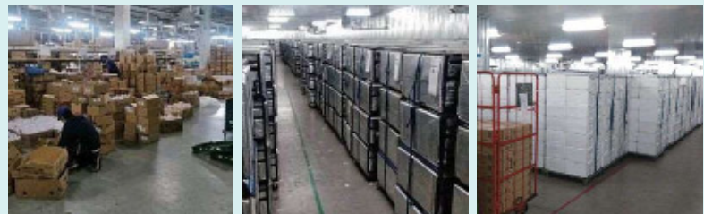
物流センターに集められた大量の商品を、注文に合わせて個人ごと・班ごとに箱づめしていきます