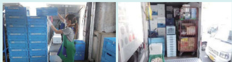
トラックにぎっしりすき間なく積み込んで出発します。

そのため、商品の配達中止や抽選での個数調整をせざるをえず、組合員のみなさまにはご迷惑をおかけする事態になっています。