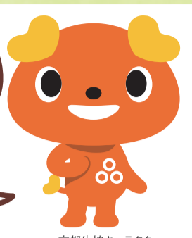
京都生協キャラクター きょうまる